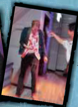
▲賓客上場客串，一面朝著受傷的醉漢潑水，一面笑場。